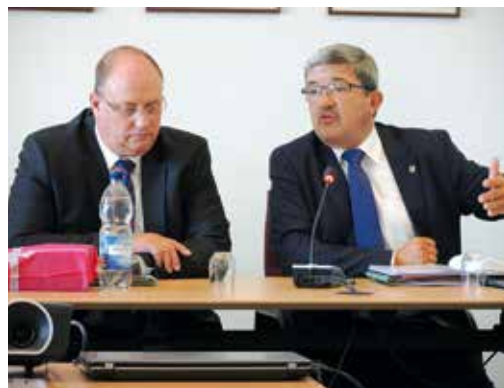
CDU-Innenminister Lorenz Caffier (r.) erläutert in der SPD-Fraktion die Lage der Flüchtlinge und beantwortet Fragen.