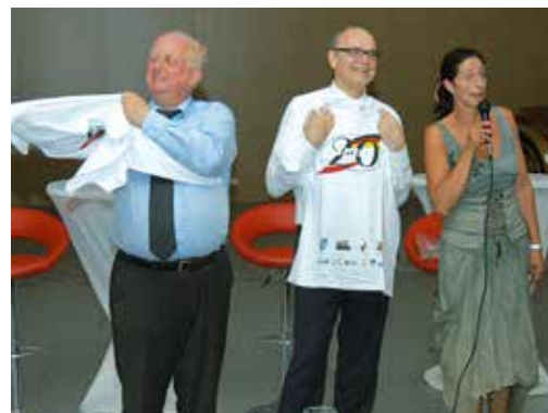
Gastgeber Heinz Müller (l.) und MP Erwin Sellering (m.) erhalten ein T-Shirt „20 Jahre Deutsch-polnisches Gymnasium“.

+++1. September 2015 +++ Zum kommunalpolitischen Abend in Pasewalk kommen über 100 Gäste (Bild rechts)+++1./2./3. September 2015 +++ Auf der Fraktionsklausur in Pasewalk berät die SPD-Fraktion den Arbeitsplan für die kommenden Monate - Schwerpunkt: Haushalt 2016/17 (Bild unten) +++ 8. September 2015 +++ Innenminister Lorenz Caffier (Bild r. u.) stellt sich den Fragen der SPD-Abgeordneten+++ 24. September 2015 +++ Die Fraktionen von SPD, CDU und LINKE stellen mit Bildungsminister Mathias Brodkorb (L.) den Inklusionsbericht vor. Im Oktober soll dieser dann im Landtag beraten werden. (2. Bild unten) +++ 24. September 2015+++Kuchenbasar der