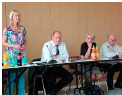
Landespolitik trifft Bundespolitik: Bundesfamilienministerin Manuela Schwesig (l.) berichtet auf der Klausur aus Berlin.