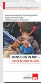
Flyer der Fraktion mit aktuellen Fragen & Antworten

Flüchtlingsrat Mecklenburg-Vorpommern Telefon: +49 (0) 385 / 581 57 90 www.fluechtlingsrat-mv.de/