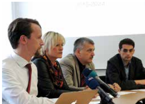
Gemeinsamer Inklusionsbericht von SPD, CDU und LINKE.