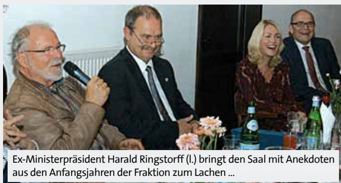
Ex-Ministerpräsident Harald Ringstorff (l.) bringt den Saal mit Anekdoten aus den Anfangsjahren der Fraktion zum Lachen ...