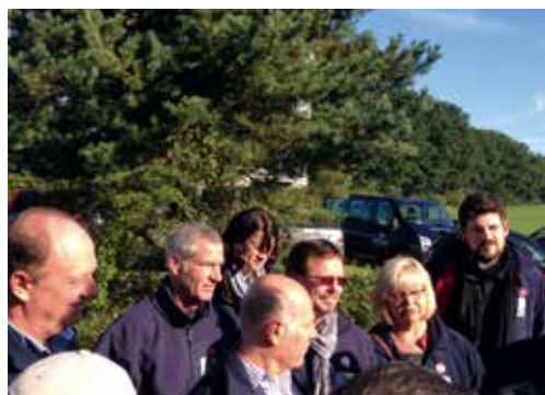
Demokraten vereint gegen NPD-Propaganda-Versuch in Horst.

Caritas Deutschland - die Einnahmen kommen der Kinder- und Jugendarbeit der Caritas zugute (Bild r. o.) +++ 28. September 2015+++ Die Abgeordneten der demokratischen Fraktionen zeigen beim Besuch der NPD-Fraktion in der Erstaufnahmeeinrichtung für Flüchtlinge in Horst, dass rechte