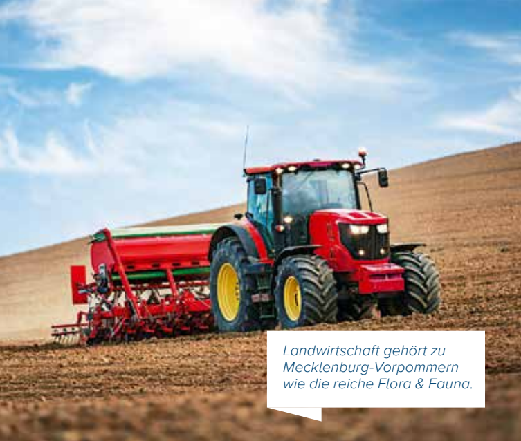
Landwirtschaft gehört zu Mecklenburg-Vorpommern wie die reiche Flora & Fauna.